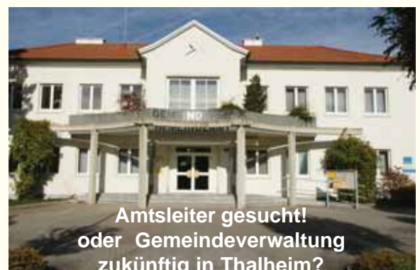
Amtsleiter gesucht! oder Gemeindeverwaltung zukünftig in Thalheim?