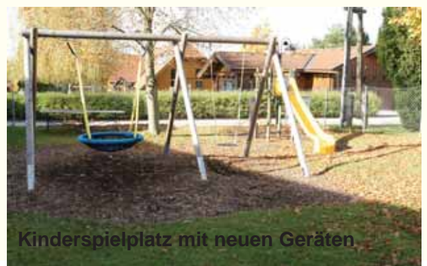
Kinderspielplatz mit neuen Geräten