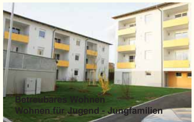
Betreubares Wohnen Wohnen für Jugend - Jungfamilien

Alt werden in der Heimatgemeinde. Durch die Welser Heim-stätten wurden Wohnungen für ein „Betreubares Wohnen“ nach dem neuesten technischen Stand (behindertengerecht, Betreuungsmöglichkeit durch die Caritas, etc.) errichtet und somit die Möglichkeit geschaffen, für unsere älteren Mitbürger 8 Woh-nungen mit einer Wohnungsgröße von ca. 59m 2 inkl. Loggia anzubieten. Es sei daran erinnert, dass die Initiative zur Bebau-ung des nunmehrigen Standortes (sog. Handlbauer-Grund) von der ÖVP-Steinhaus ausgegangen und letztlich durchgesetzt wur-de.