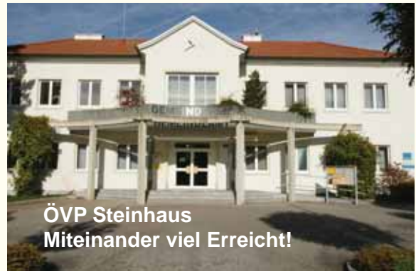
ÖVP Steinhaus Miteinander viel Erreicht!

Lärm, Staub und Verkehrschaos erfolgreich verhindert: Durch die Bemühungen der ÖVP-Steinhaus konnte die FP davon überzeugt werden, dass die Schaffung von neuen Baugründen auch eine ordentliche Verkehrsplanung benötigt. Durch die Errichtung der von uns verlangten Aufschließungsstraße zu den sogenannten Schlossgründen konnte ein vernünftiges Verkehrskonzept für Steinhaus erreicht werden und vor allem die Anwohner der Siedlung (Eiselsbergstraße, Hubingerstraße) vor Verkehrslärm, Staub und Belästigung durch die Bauarbeiten geschützt werden. Wäre es nach dem Bürgermeister gegangen, wäre der gesamte Baustellenverkehr durch diese Siedlung geführt worden!