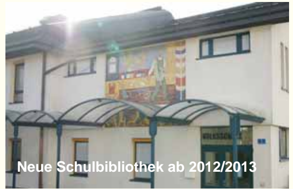
Neue Schulbibliothek ab 2012/2013