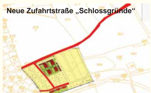
Neue Zufahrtstraße „Schlossgründe“