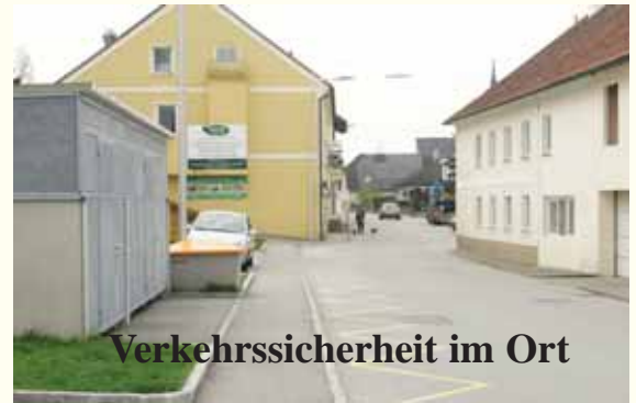
Verkehrssicherheit im Ort