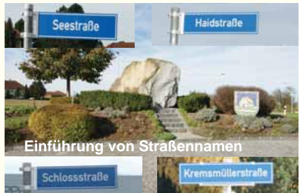
Einführung von Straßennamen