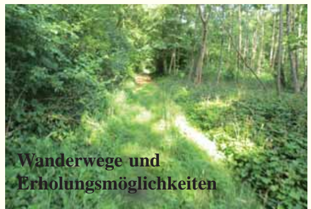
Wanderwege und Erholungsmöglichkeiten