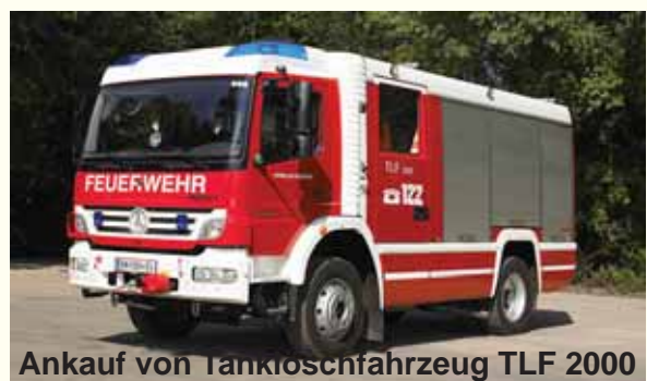
Ankauf von Tanklöschfahrzeug TLF 2000