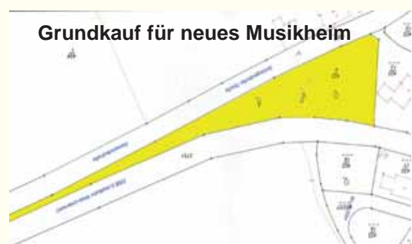
Grundkauf für neues Musikheim